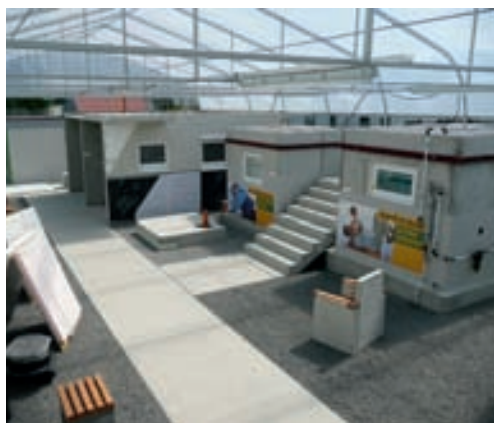
Ständige Ausstellung am Hauptsitz in Metzingen