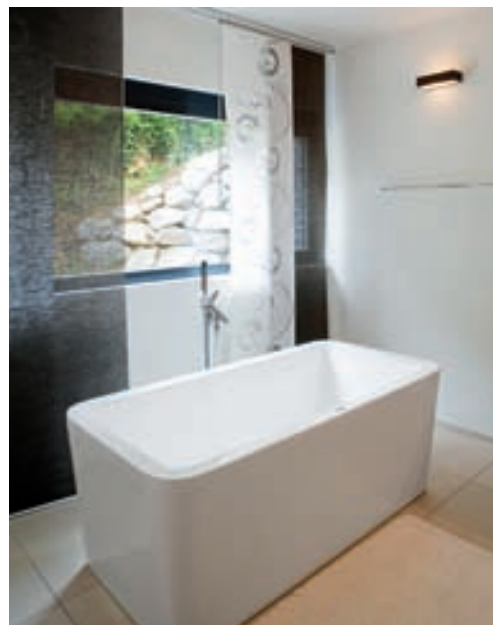
Bauwerksbeispiele der Knecht manufaktur